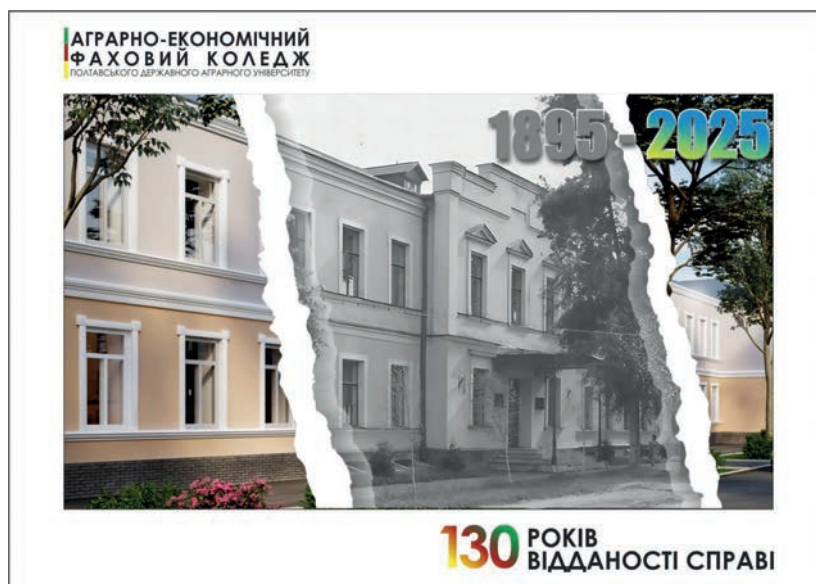
Рис. 3. Тематична поштова картка (листівка).

підрозділу АТ «Укрпошта» разом з фінальними версіями дизайн-макетів у цифровому форматі. Ключовими технічними вимогами до макетів були висока роздільна здатність графічних файлів для уникнення будь-яких дефектів під час друку; дотримання специфічних шаблонів для аркуша з марками, де чітко визначено поле для самого зображення та службові елементи; відповідність стандартним розмірам для супутньої продукції: конверти формату DL (110 x 220 мм) та поштові картки формату А6 (105 x 148 мм). Цей формалізований процес гарантував відповідність продукції державним стандартам якості. На шляху від макета до готового тира-