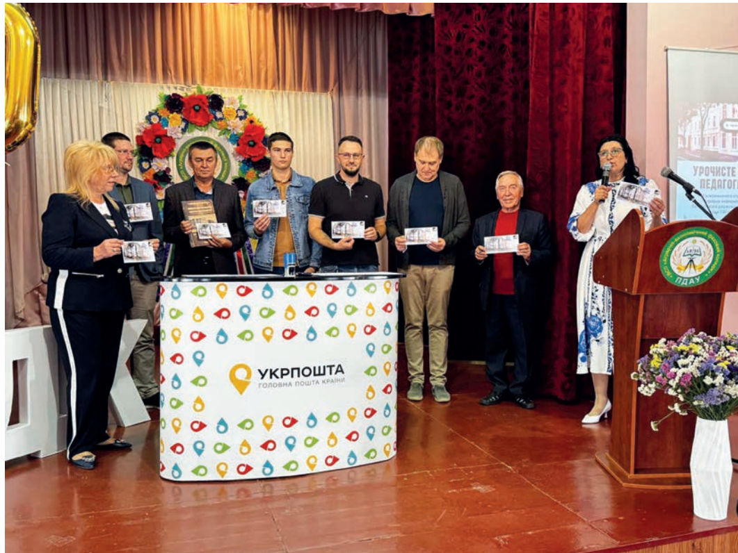
Рис. 7. Вручення філателістичних комплектів почесним гостям.

першоджерелом для майбутніх істориків, краєзнавців та культурологів. На відміну від вторинних джерел, що описують подію (статей, спогадів), цей конверт є її безпосереднім мовчазним учасником, несучи в собі кілька шарів задокументованої інформації; містить візуальний код, фіксуючи офіційну символіку та архітектурний образ коледжу станом на 2025 рік; є часовою міткою, адже відбиток штемпеля чітко датує подію — 8 вересня 2025 року; має географічну та ідеологічну прив'язку, оскільки використання штемпеля «Полтавщина. Край любові» назавжди пов'язує ювілей коледжу з культурним та патріотичним контекстом регіону в один із найдраматичніших періодів історії України. Для дослідника з майбутнього цей конверт стане своєрідною «капсулою часу», розповість про те, що навіть в умовах повномасштабної війни український освітній заклад освіти не просто виживав, а й знаходив у собі сили та креативність, що є матеріальним доказом незламності духу та поваги до власних коренів. Попри те, що традиційні медіа детально вивчені наукою, такий потужний канал комунікації, як філателія, часто залишається поза увагою. Проте поштові