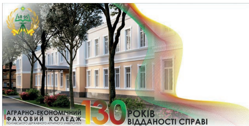
Рис. 2. Немаркований художній конверт ювілейного випуску.