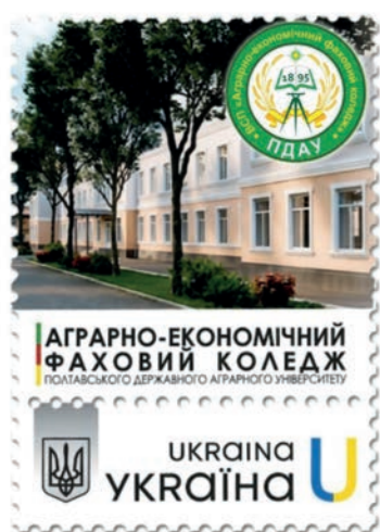
Рис. 1. Персоналізована поштова марка до 130-річчя ВСП «Аграрно-економічний фаховий коледж ПДАУ».