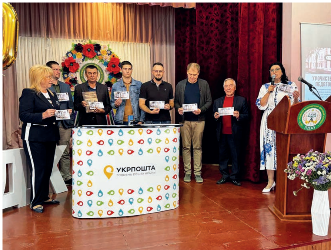
Рис. 7. Вручення філателістичних комплектів почесним гостям.

першоджерелом для майбутніх істориків, краєзнавців та культурологів. На відміну від вторинних джерел, що описують подію (статей, спогадів), цей конверт є її безпосереднім мовчазним учасником, несучи в собі кілька шарів задокументованої інформації; містить візуальний код, фіксуючи офіційну символіку та архітектурний образ коледжу станом на 2025 рік; є часовою міткою, адже відбиток штемпеля чітко датує подію — 8 вересня 2025 року; має географічну та ідеологічну прив'язку, оскільки використання штемпеля «Полтавщина. Край любові» назавжди пов'язує ювілей коледжу з культурним та патріотичним контекстом регіону в один із найдраматичніших періодів історії України. Для дослідника з майбутнього цей конверт стане своєрідною «капсулою часу», розповість про те, що навіть в умовах повномасштабної війни український освітній заклад освіти не просто виживав, а й знаходив у собі сили та креативність, що є матеріальним доказом незламності духу та поваги до власних коренів. Попри те, що традиційні медіа детально вивчені наукою, такий потужний канал комунікації, як філателія, часто залишається поза увагою. Проте поштові