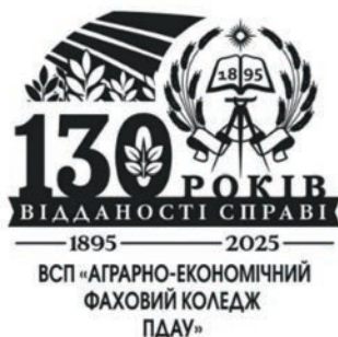
Рис. 5. Спеціальний сувенірний штамп «130 років відданості справі».