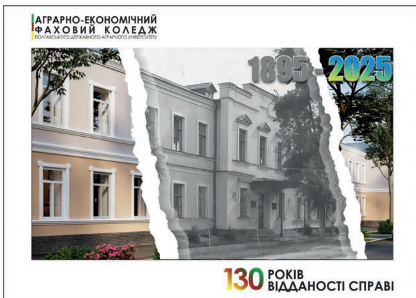
Рис. 3. Тематична поштова картка (листівка).

підрозділу АТ «Укрпошта» разом з фінальними версіями дизайн-макетів у цифровому форматі. Ключовими технічними вимогами до макетів були висока роздільна здатність графічних файлів для уникнення будь-яких дефектів під час друку; дотримання специфічних шаблонів для аркуша з марками, де чітко визначено поле для самого зображення та службові елементи; відповідність стандартним розмірам для супутньої продукції: конверти формату DL (110 x 220 мм) та поштові картки формату А6 (105 x 148 мм). Цей формалізований процес гарантував відповідність продукції державним стандартам якості. На шляху від макета до готового тира-