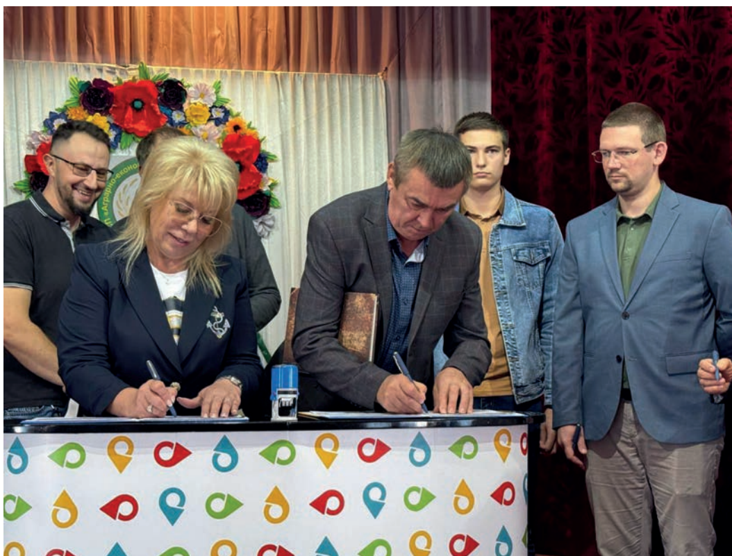
Рис. 6. Центральний момент церемонії спеціального погашення.

календарного штемпеля було обрано постійно діючий спеціальний поштовий штампель «Полтавщина. Край любові. Poltava Region. Homeland of love». Цей стратегічний хід дозволив вписати локальну подію в ширший регіональний та загальнонаціональний контекст, адже історія коледжу миттєво стала частиною великої історії та культурного бренду Полтавщини; підвищив колекційну цінність погашених екземплярів шляхом поєднання унікального конверта з відомим художнім штампелем. Акт спецпогашення став центральним, символічним моментом церемонії (Рис. 6). Почесні гості одночасно поставили відбитки штемпеля «Полтавщина. Край любові»