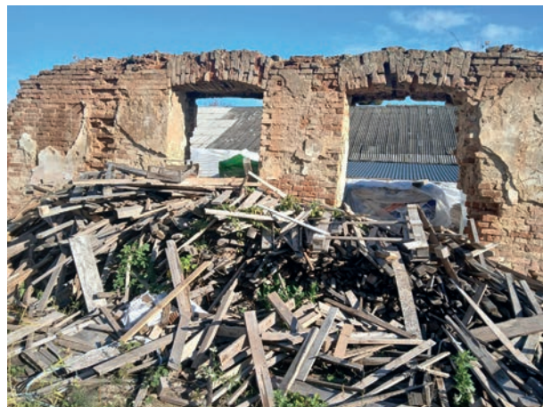
Рис. 2. Залишки фасаду театру Потоцьких у Тульчині. Фото 2025 р.

1787 р., залишки центральної частини якого збереглися до наших днів (Рис. 1, 2).