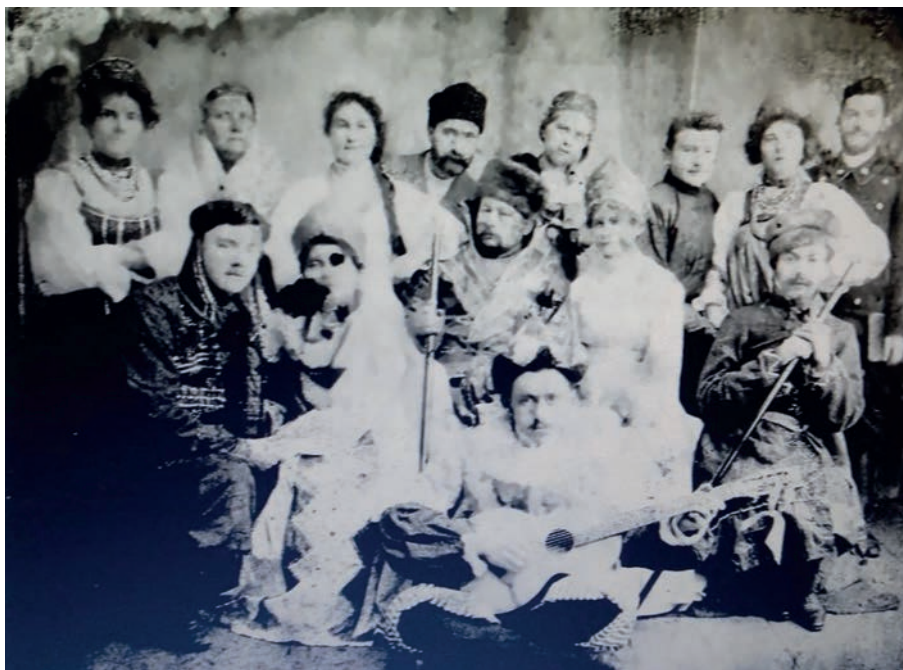
Рис. 4. Трупа Тульчинського театру Пташинського. Тульчин, 1903 р.

Свою діяльність міський театр, імовірно, завершив під час революції 1917 р. Невідомо, хто перебував у цій будівлі в період з 1917-го по 1927–28 рр. В умовах, коли в місті катастрофічно не вистачало приміщень для навчальних закладів, пустою ця будівля стояти не могла.