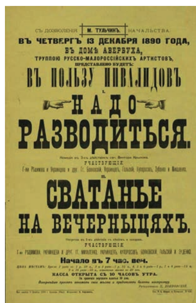
Рис. 3. Афіші Тульчинського міського театру Пташинського. Тульчин, 1890 р.