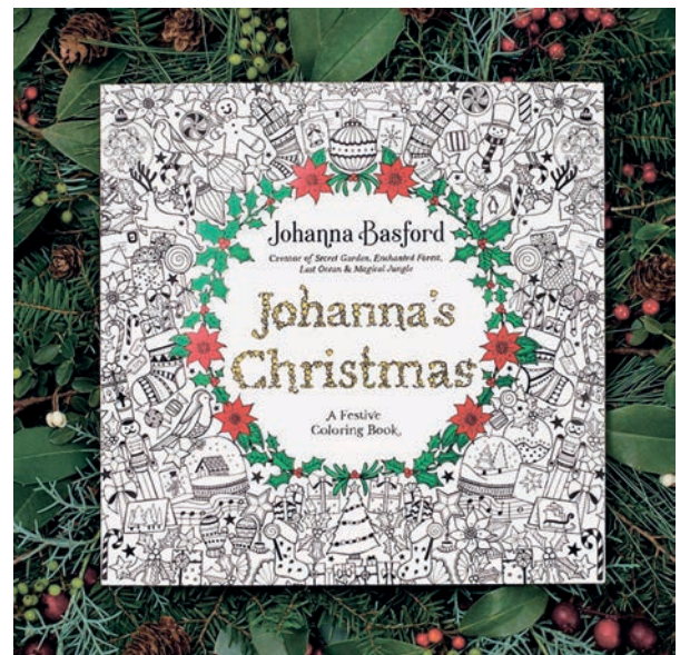
Рис. 1г. Книга «Різдво Джоанни» Джоанни Басфорд Fig. 1d. The book "Joanna's Christmas" by Joanna Basford

Ілюстрації мають великий вплив на емоційний стан людини, оскільки вони викликають у ній різноманітні почуття та асоціації. Колір, композиція, форма та використання деталей у графічних зображеннях можуть надати різних емоційних вражень. Наприклад, яскраві кольори та позитивні образи на обкладинці книги можуть викликати радість та задоволення у читача, що спонукає його відчувати позитивні емоції і бажання дізнатися більше про вміст книги. Важливе значення мають положення, сформульовані в літературі з психології, про взаємозв'язок