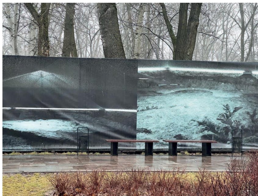
Pic. 6. The future project “Memory Mound”, Babyn Yar Museum, Kyiv, Ukraine.