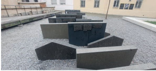
Рис. 2. «Synagogue Square», Lviv, Ukraine.

cultural influence of the Jewish community on urban architecture, the authors of the concept emphasize the preservation of the ethnic heritage of Ukraine. It can be said that the fragmentary nature of the life/memory categories is fully realized in the memorial.