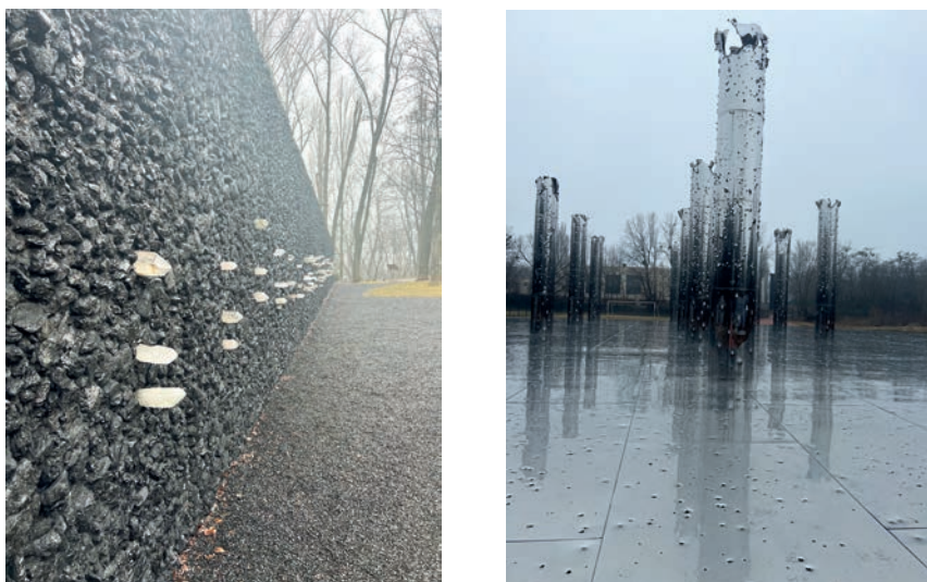
Pic. 3–4. “The Crystal Wailing Wall”, “The Tree of Life”, Babyn Yar Museum, Kyiv, Ukraine.