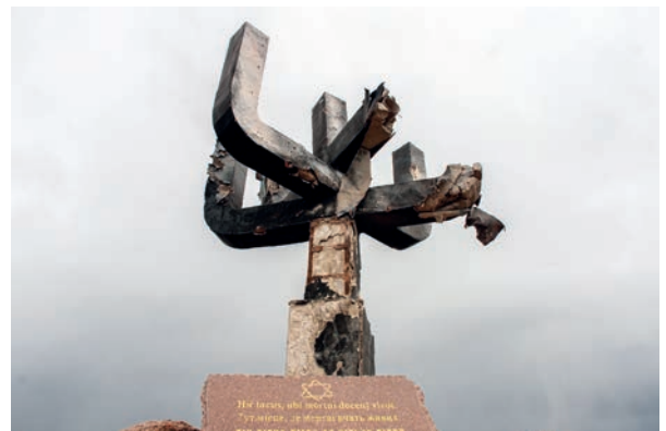
9. Menorah, Drohobych Yar, Kharkiv region, Ukraine.