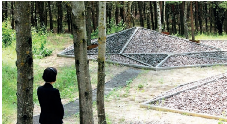
Pic. 7. Holocaust Memorial, Bakhiv village, Volyn region, Ukraine.

The contents of the Holocaust are symbolically represented in the monument to the dead Jews in the village of Bakhiv, Volyn region. It consists of artificial mounds of different heights, symbolizing the waves of life (pic. 7). It is assumed that the viewer