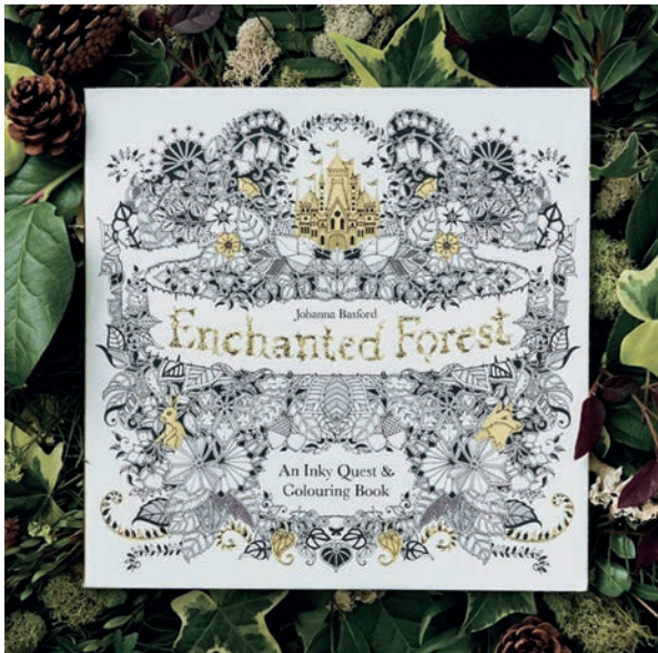
Рис. 1а. Книга «Зачарований ліс» Джоанни Басфорд Fig. 1a. Book "Enchanted Forest" by Joanna Basford