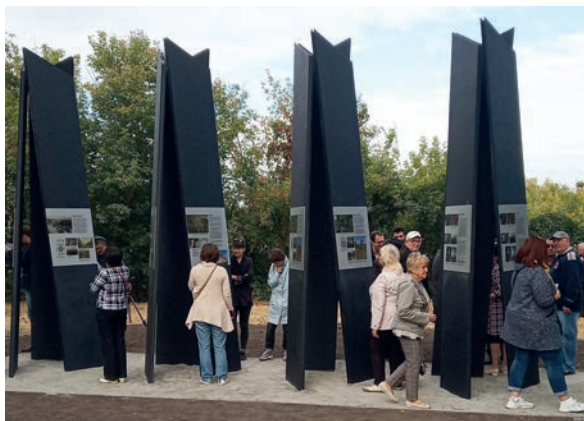
Pic. 8. Memorial, Berdychiv, Ukraine.