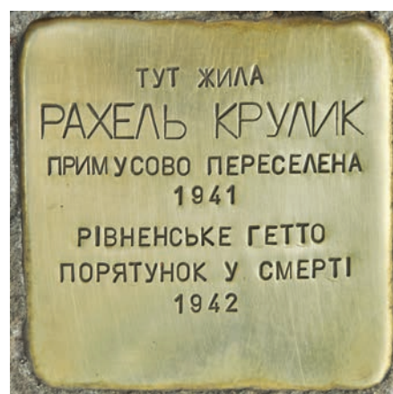
Pic. 1. «Stumbling block», Kyiv, Ukraine.

Currently, Ukraine has installed stones in Kyiv and Rivne (pic. 1) and plans to expand such a commemorative initiative in the future.