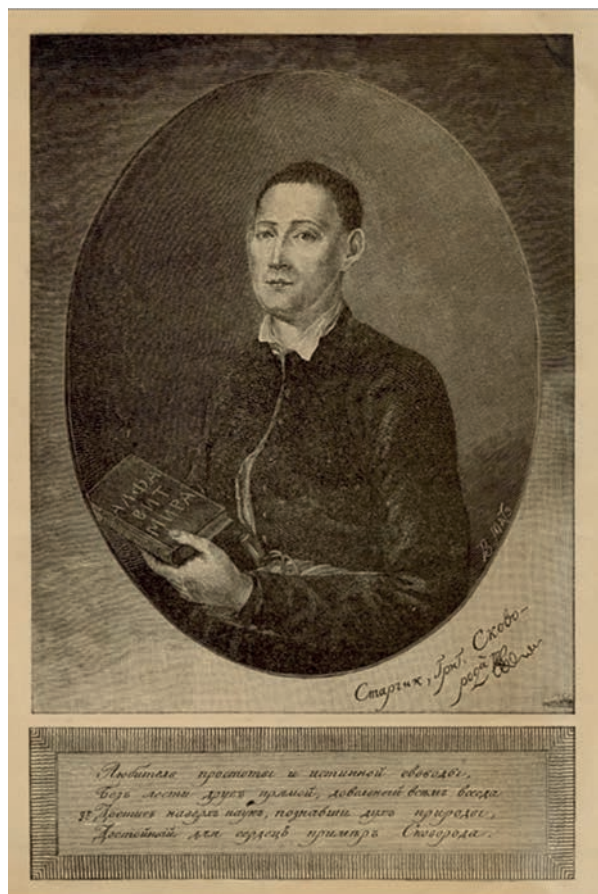
Іл. 3. В. Мате. Портрет Г. Сковороди (Сочинения Григория Саввича Сковороды, собранные и редактированные проф. Д. И. Багалеем. Юбилейное издание (1794–1894 год), 1894, вклейка).

Аналіз мальованих портретів Г. Сковороди дозволяє додати кілька важливих аспектів до розуміння іконографії образу. По-перше, внаслідок порівняння їх із найдавнішими гравюрами можна впевнено стверджувати, що філософ позував сидячи, поклавши руки на зігнуті ноги, а художник зображав його, дивлячись на обличчя знизу догори. Цим фактом пояснюється певна «неприродність» пози, відзначена Д. Степовиком. По-друге, маємо підстави для висновку, що під лівою рукою зображено торбу, а не пояс, як уважалося раніше. Найбільш виразно цей аксесуар виписано на портреті, що зберігається в Національному музеї Тараса Шевченка (іл. 1:4).