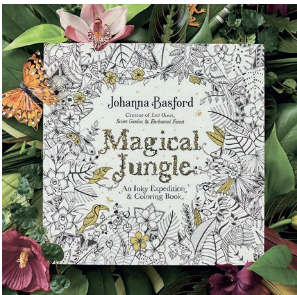
Рис. 1в. Книга «Магічні джунглі» Джоанни Басфорд Fig. 1c. The book "The Magical Jungle" by Joanna Basford