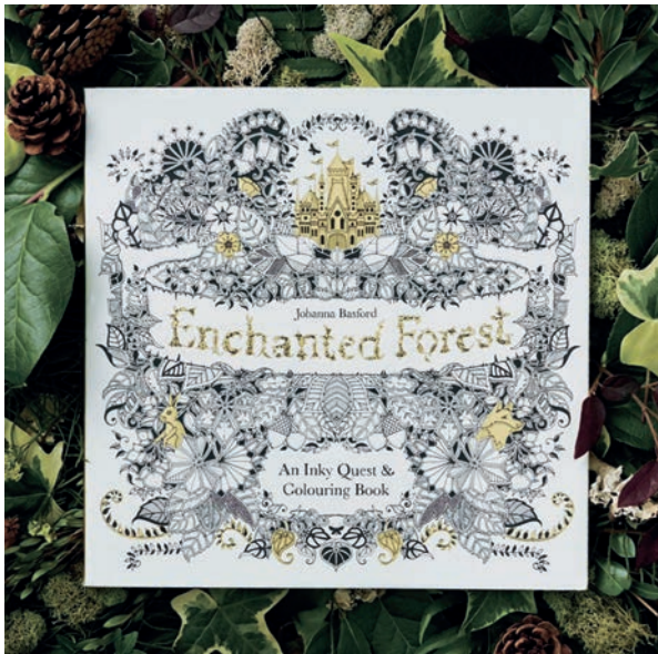
Рис. 1а. Книга «Зачарований ліс» Джоанни Басфорд Fig. 1a. Book "Enchanted Forest" by Joanna Basford