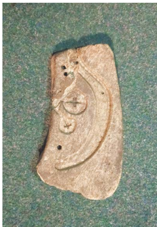
Іл. 4. Фрагмент негатива літейної форми для виготовлення псалія (?) із бронзи із с. Токівське Апостолівського р-ну Дніпропетровської обл.

цього необхідно з'ясувати, по можливості, час і обставини знахідок гіпологічних артефактів на території Дніпропетровської і Харківської областей. Насамперед, бажано звернути увагу на знахідки в Дніпропетровському національному історичному музеї. Найбільш ранній артефакт такого роду в колекції ДНІМ був знайдений на початку ХХ ст. В. О. Городцовим. Це фрагмент кістяної пряжки з отвором із с. Бабіне Бахмутського повіту, який тоді входив до складу Катеринославської губернії [І, Б, № 3]. Інші артефакти, які представляють підрозділи «Кістки коня», «Вироби із кістки коня», «Вудила та псалії», стали наслідком археологічних експедицій та розвідок, які здійснювали співробітники Дніпропетровського історичного музею після 1945 р. [І, А, №№ 1–15; Б, №№ 1–2, 4–18; В, 1–3]. Артефакти виявлені унаслідок експедицій А. В. Бодяньського в 1946 р., Ю. С. Кравцової в 1977 р., експедицій ДНІМ в 1980, 1985, 1989, 1991 рр., експедицій та розвідок В. А. Ремашка та О. Г. Ярового в 1999 та 2008 рр., Д. Я. Тесленка в 2007 та 2010 рр., Е. Я. Фіщенка в 2010 р., О. В. Старіка в 2015, 2017 та 2018 рр., тощо. Що стосується візка в експозиції ДНІМ [І, Г, № 1], то його було знайдено Л. П. Криловою в 1979 р. на околицях м. Кривий Ріг в одному з курганів доби бронзи (Мельник & Стеблина, 2012, с. 407). Як бачимо, багато артефактів,