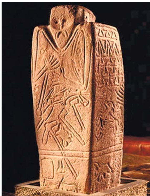
Лл. 6. Зображення коней на нижній частині кам'яної стели із с. Керносівка Новомосковського р-ну Дніпропетровської обл.

Висновки. Аналіз матеріалів з археологічних колекцій музеїв Дніпропетровської та Харківської областей свідчить про те, що не всі матеріали за обраним періодом знайшли своє відображення у звітах, які зберігаються в Науковому архіві Інституту археології НАНУ, та публікаціях. Багато з них ніде так і не були зафіксовані, окрім як у каталогах музеїв, оскільки вони потрапили до музеїв випадково. Вони мають також уводитись до наукового обігу. На підставі вивченого матеріалу можна зробити попередній висновок, що лише в період пізньої бронзи у степах України мав місце перший етап доместикації коня. Про більш ранню дату цих процесів немає підстав говорити. На сучасному етапі наука має певні сумніви щодо існування конярства за часів енеоліту, ранньої та середньої бронзи. Але цій концепції суперечить музейна документація, згідно з якою вже з часів енеоліту неначе вже існували артефакти, що мають підтверджувати процес доместикації коня. Це відображає підходи дослідників минулих десятиліть. Тому настав час переглянути музейну документацію з позицій сучасної науки. Це можливо лише при об'єднанні зусиль працівників музейних фондів і археологів та палеозоологів. І запропонована стаття з каталогом мають допомогти в цьому.