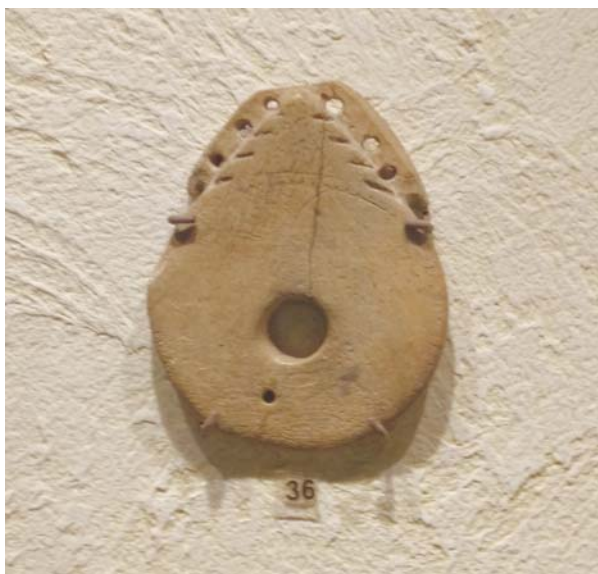
Лл. 1. Псалій із поселення Поляни-І Ізюмського р-ну Харківської обл.

коня (Усачук, 2005, с. 143–150). Не менш цікавим в експозиції Музею археології ХНУ є уламок кістяного псалю (ил. 2), прикрашеного циркульним орнаментом [II, В, № 2]. Його було знайдено при розкопках зольника на території Західного Більського городища Полтавської області. Ця знахідка була опублікована у статті І. Б. Шрамко та С. В. Вальчака у 1996 р. (Вальчак & Шрамко, 1996, с. 146–151). Як виявилось, у дослідників досі немає єдиної думки щодо часу виготовлення цього псалю. Так, на думку С. В. Вальчака, цей псалій слід відносити до бронзового віку. Проте І. Б. Шрамко та С. А. Задніков схильні відносити артефакт до ранньоскіфського періоду. Цікавою є також знахідка фрагменту кістяного псалю, який датується науковими працівниками Чугуївського музею періодом пізньої бронзи (ил. 3); він зберігається у фондах цього ж музею [III, В, № 1].