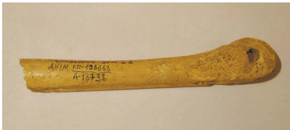
Іл. 5. Фрагмент «ковзана» із кістки коня доби пізньої бронзи із с. Мар'янівка Новомосковського р-ну Дніпропетровської обл.

пов'язаних із раннім конярством та гіпологією, із зібрань ДНІМ були виявлені професійними археологами під час польових археологічних досліджень і їхня атрибуція не має піддаватися сумніву. Хоча погляди археологів з часом можуть змінюватись.