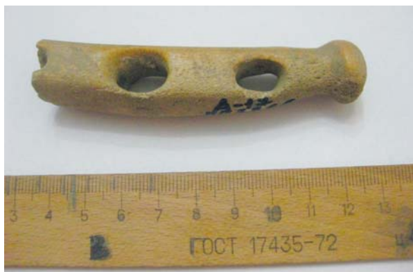
Іл. 3. Фрагмент кістяного псалію періоду пізньої бронзи з південного узбережжя Печенізьського водосховища.

полози робилися із кістки коня, ніщо не може заважати тому припущенню, що в такі первісні сані могли впрягати коней. Ці транспортні засоби можна було використовувати будь-якої пори року, про що може свідчити відполірованість полів із кістки коня. Саме це дозволяло, наприклад, без перешкод рухатись по траві.