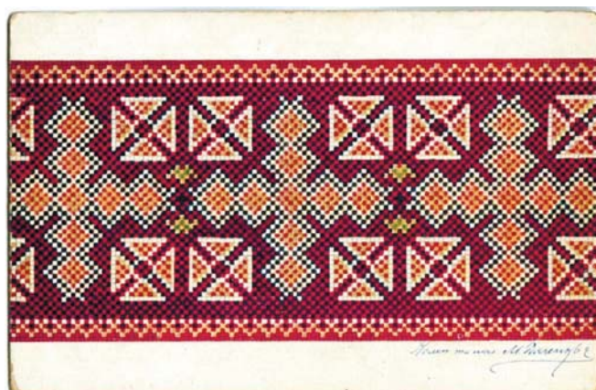
Рис. 1–3. Михайло Дяченко. Листівки «Мотиви українського орнаменту». Папір, друк. Київ, видавництво «Час», 1911. Приватні колекції