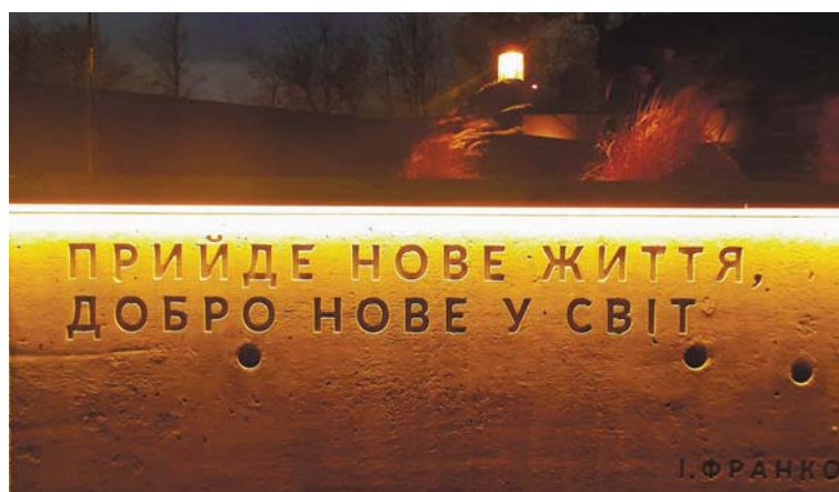
Рис. 6б. Епіграф І. Я. Франка.