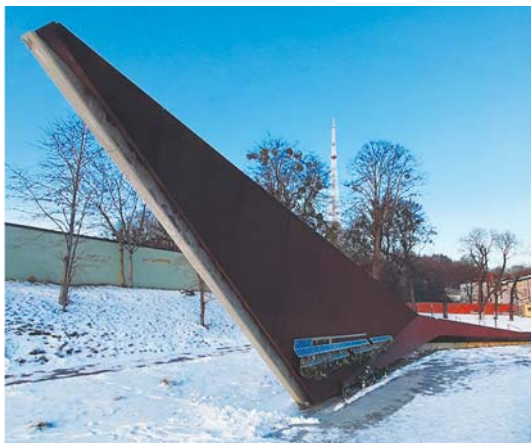
Рис. 5а. Кульмінація композиції на фоні виду Високого Замку.