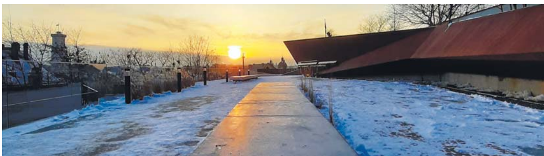
Рис. 4. Матеріал для сидінь — бетон.