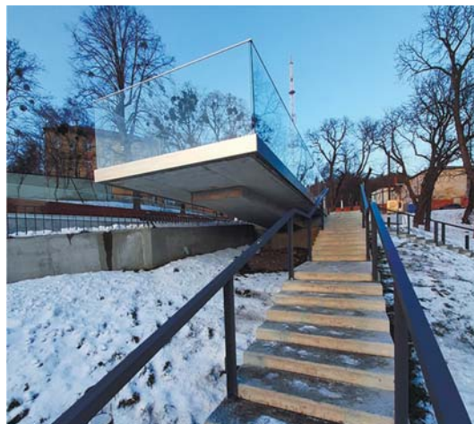
Рис. 5б. Один із підйомів до Меморіалу.