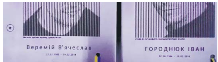
Рис. 3. Портрети на стелі. Фото автора.