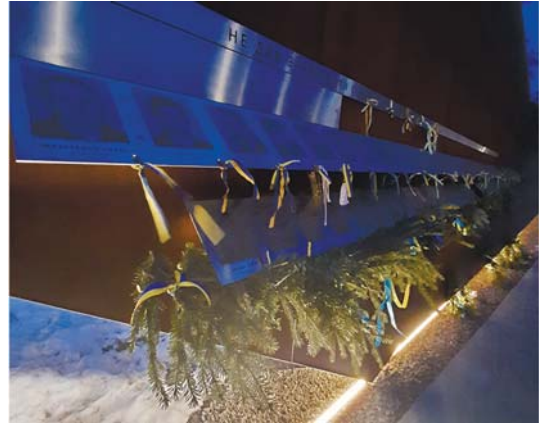
Рис. 2б. Хаос просторової структури.