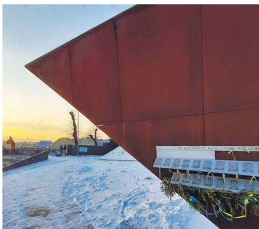
Рис. 5в. Кульмінація композиції на фоні виду на центральну частину міста.