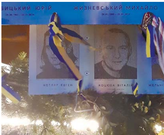
Рис. 2в. Контрове світло б'є в очі.