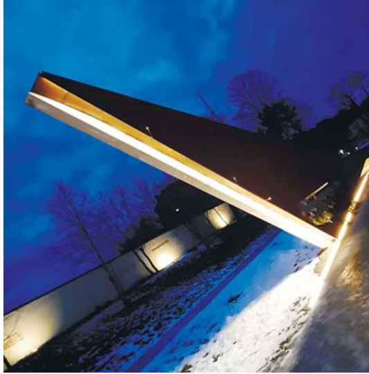
Рис. 2а. Підсвітка стели в темний час доби.

Zvereva, G. I. (2003). Civilizational specificity of Russia: discourse analysis of the new «historiosophy». Obshchestvennye nauki i sovremennost' , 4, 98–112. [In Russian].