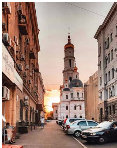
Рис. 1. Успенський собор. Зображення XXI ст.