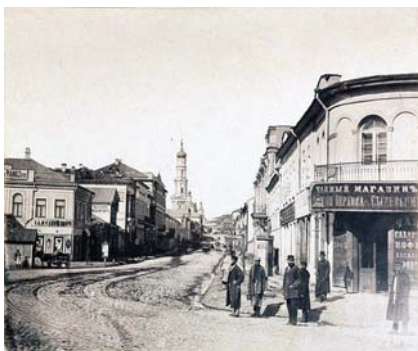
Рис. 2. Успенський собор. Зображення XIX ст.