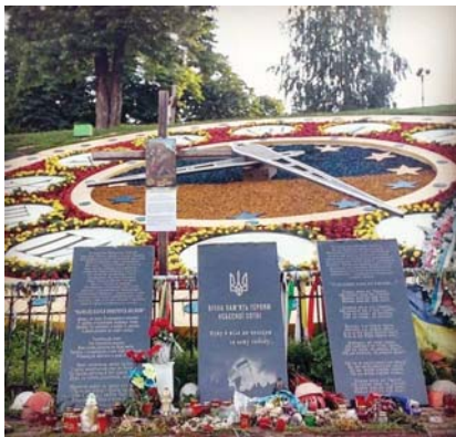
Рис. 4. Годинник-меморіал

Висновки. На відміну від усталених наукових дисциплін і широких міждисциплінарних програм дослідження феномену візуального («візуальна культура», візуальна антропология, візуальна соціологія тощо), культурологічний підхід має ґрунтуватись на значно ширшому предметі і методологічному горизонті. Його предметом може бути названий взаємозв'язок між візуальністю та культурою в глобальному чи локальному вимірах. Методологічним горизонтом водночас є інтерпретація специфіки візуальних конструкцій як вияву глибинних чи поверхових соціокультурних трендів й ідентифікація процесів зворотного впливу різних аспектів візуального на культуру. Він має застосовувати раціональне співвідношення кількісно-якісних дослідницьких інструментів (за аналогом із контент-аналізом). Статистичні методи є важливими щодо збирання автентичних і репрезентативних джерел для дослідження, якісні — для її внутрішньої критики. Результати дослідження якнайкраще визначають показники візуальної привабливості тих чи інших культурних феноменів як відображення співвідношення між різними складовими культурної системи, рівня її модернізованості. А кількісне вимірювання історико-культурної еволюції знакових для певної сучасної культури проявів візуального дозволяє визначитись із рівнем