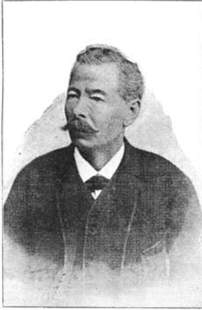
1. Теодор Сідолі. Джерело: Saltarino, Signor – Artisten-Lexikon: biographische Notizen über Kunstreiter, Dompteure, Gymnastiker, Clowns, Akrobaten, Specialitäten etc.: aller Länder und Zeiten / S. Saltarino. – Düsseldorf: Druck und Verlag von Ed. Lintz, 1895. – S. 195

Незабаром львівська газета «Iskra» писала, що цирк пана Сідолі, який завітав до Львова на початку червня і розклав свої «пенати» у дерев'яній будівлі на площі Каструм, спочатку збирав натовпи публіки, однак незабаром інтерес громадськості до загнuzданих коней, лукавих клоунів та амазонок почав згасати; цирк не розраховував на сприятливий гороскоп у майбутньому і, здавалося, мав намір залишатися у Львові коротший час, ніж планувалося від самого початку (1887, Nr. 12). Утім, здається, це була, радше, суб'єктивна думка, зумовлена упередженим ставленням редакції видання до циркового мистецтва, ніж аналізом реального стану справ у цирку Сідолі. На початку липня в часописі «Dziennik Polski» (1887, Nr. 187) писалось, що виступи трупи пана Сідолі користувалися постійним заслуженим успіхом у львів'ян, завдяки добірній програмі і точності виконання кожного її номеру. Улюбленими публіки стали: родина Сідолі, оскільки їхня над-