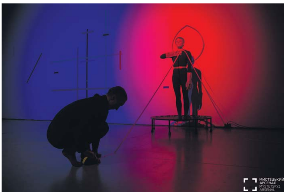
Фото 4. Сцена з вимірною стіною.